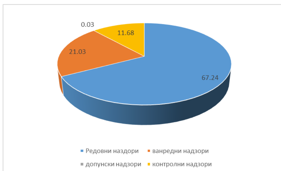
Извршени инспекцијски надзори у 2017. по врстама надзора

Ванредни инспекцијски надзори чине 21,03 % укупног броја извршених инспекцијских надзора у 2017. години.